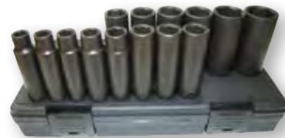
Kit de chaves de caixa